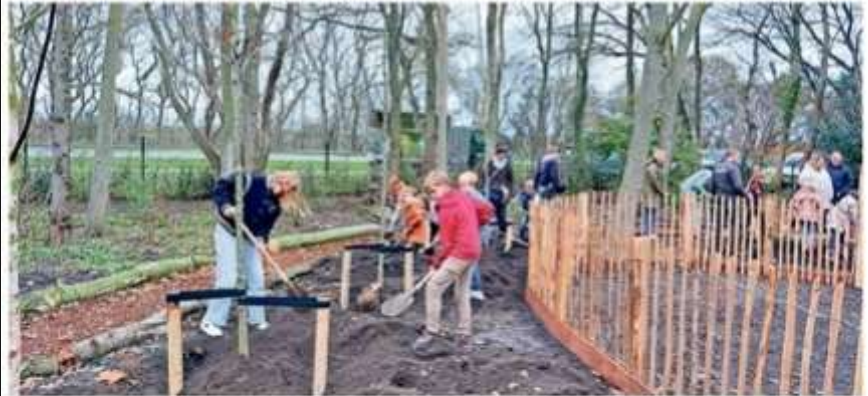
> De kinderen plantten jonge bomen en vulden de nieuwe moestuinbakken met viooltjes.

nisaties het terrein zichtbaar opgeknapt. Als extra bijdrage schonk Weverling zes grote bloembakken. Scouting Polanen zegt daarover: "Dankzij hun bijdrage heeft ons terrein een prachtige nieuwe uitstraling gekregen."